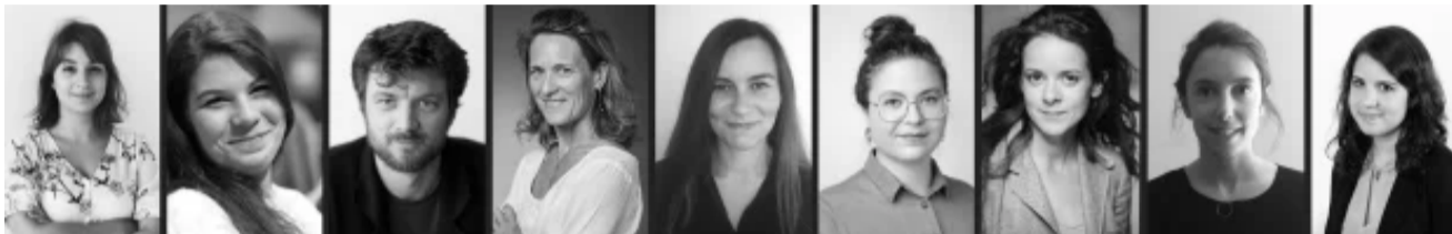
Les fondateurs d'Arviva

Lancée par des pros de la musique classique et du spectacle vivant, l'association Arviva se lance pour accompagner le secteur culturel dans ses démarches d'éco-responsabilité.